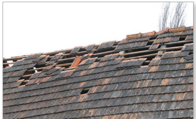
Takšni in podobni so bili pogledi na strehe, pokrite s strešniki.

Vetra smo v zadnjih letih vajeni že tudi pri nas, a ta piha skoraj že vsak dan. Ko bi le pihal. Žal pa imajo sunki vetra zelo pogosto vidne posledice. Kot so odkrite strehe, podrta drevesa, takšni in drugačni drogovci in še kaj.