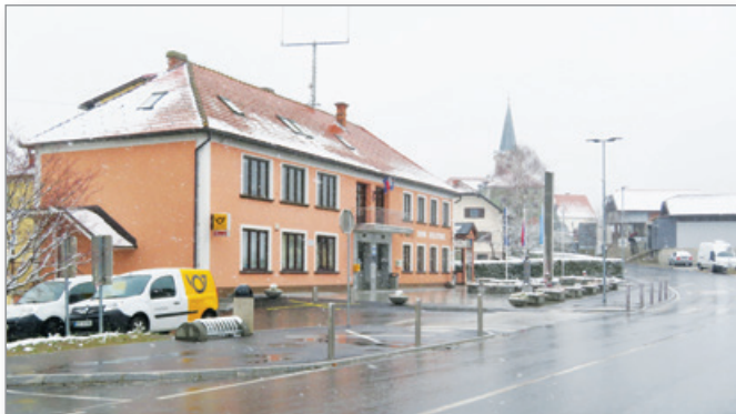
Cerkvenjačanke in Cerkvenjačani so poziv »Ostani doma« vzeli resno, kar dokazuje tudi naša fotografija središča občine in kraja.

Za spremembo stila življenja ljudi po vsem svetu, tudi v Cerkevniku, je kriv novi koronavirus imenovan SARS-CoV-2, ki povzroča bolezen covid-19. Ta dotlej neznan virus se je začel širiti konec lanskega in na začetku letošnjega leta iz mesta Wuhan v pokrajini Hubei na Kitajskem. Strokovnjaki menijo, da so ga med ljudi raznesli netopirji, ki so zaradi podnebnih sprememb začeli iskati hrano v bližini urbanih naselij. V globaliziranem svetu, kjer ljudje dnevno množično potujejo iz države v državo in iz kontinenta na kontinent, se je novi koronavirus hitro razširil v Evropo, še zlasti v sosednjo Italijo. Pričakovano se je kmalu začel širiti tudi pri nas, sprva v Ljubljani in Beli krajini, nato pa povsod po Sloveniji. Konec marca (26. 3.) so vsaj en primer okužbe z novim koronavirusom zabeležili že v blizu 120 občinah v Sloveniji. V osrednjih Slovenskih gorinah so do takrat zabeležili okužene v Lenartu in Sveti Ani.