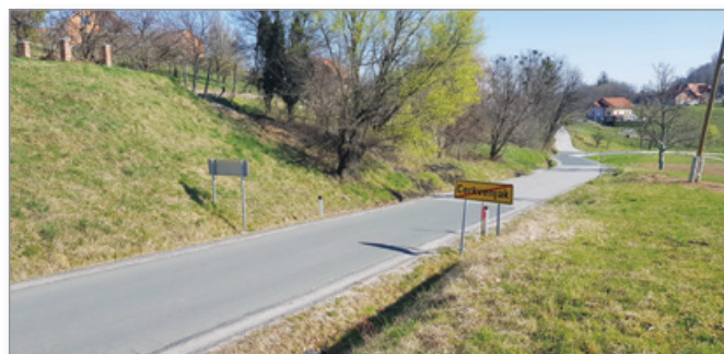
Območje obnove regionalne ceste in izgradnje pločnika z JR

Skupaj z Direkcijo RS za infrastrukturo (DRSI) smo že konec leta 2019 pričeli tudi s potrebnimi predhodnimi aktivnostmi za obnovo regionalne ceste in izgradnjo pločnika na odseku regionalne ceste R III-734, odsek 4123 (odsek med križiščem pri vili »Tušak« do križišča za naselja Stanetinci in Andrenci).