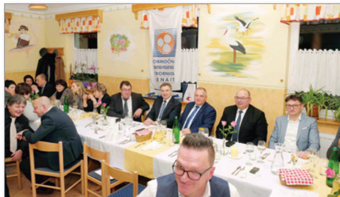
Omizje z vabljenimi gosti na 40-letnici OOO Lenart v gostinskem lokalu družinskega podjetja Gostinstvo in turizem Breznik d.o.o. v Komarnici v Cerkevniku