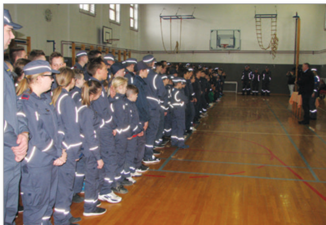
Telovadnica v Cerkenjaku je bila za vse udeležence kviza skoraj premajhna.

Kviz je potekal v treh kategorijah; pionirji, mladinci in pripravniki. V kategoriji pionirji je sodelovalo 18 ekip, prvo mesto je dosegla ekipa iz PGD Osek, drugo PGD Sv. Trojica in tretje PGD Selce. Pri mladincih je sodelovalo 21 ekip, prvo mesto je pripadlo ekipi PGD Sv. Trojica 1, drugo PGD Selce in tretje PGD Sv. Trojica 2. V konkurenci pripravniki je tekmovalo pet ekip, prvo mesto je dosegla ekipa PGD Benedikt, drugo PGD Sv. Trojica in tretje PGD Osek 1.