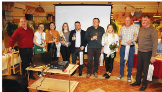
Člani društva, ki praznujejo okroglo obletnice rojstva

Tudi v lanskem letu je bila organizacija in izvedba izobraževanj naših vinogradnikov ena izmed pglavitnih nalog in ciljev našega društva. Da smo bili pri tem uspešni, nam kaže dober obisk na naših delavnicah in predavanjih, ki jih organiziramo v časovnih obdobjih, ko so potrebne, trudimo si pripeljati strokovnjake, od katerih pridobimo znanje in dobre nasvete. Rezultati pa se kažejo predvsem v društvenih ocenjevanjih vina, doma in pa tudi drugih društvih ob ocenjevanjih, kjer vina naših članov dosegajo vrhunske rezultate Poseben namen med našimi izobraževanji imajo tako imenovane Kletarske delavnice, ki jih zadnja leta prirejamo skupaj s sosednjim Društvom Vinogradnikov Sveta trojica kot panožni krožek s pomočjo Kmetijsko svetovalne službe Lenart.«