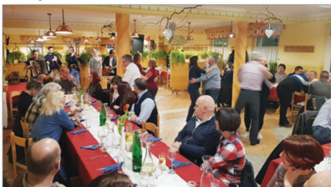
Občni zbor 2020

Na občnem zboru kluba, dne 8. 2. 2020, se nas je ponovno zbralo prek 40 članov.