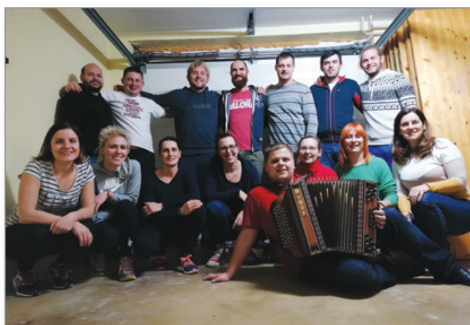
Prva skupna fotografija med zadnjimi vajami v letu 2019

In še vedno velja: Vabljeni vsi, tisti s soplesalkami/soplesalci, pa tudi tisti brez njih, da se nam pridružite na vajah, vsak ponedeljek ob 19.30 v dvorani kulturnega doma.