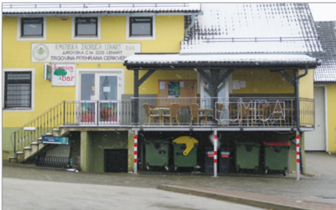
Tudi vrt v Šumici, ki je sicer priljubljeno zbirališče domačinov, je sameval.

Konec marca je bila večina prebivalcev Občine Cerkevjak doma, ker so upoštevali prepoved zbiranja in gibanja na javnih mestih. Doma so bili tudi šolarji, dijaki in študenti, za katere so šole organizirale izobraževanje na daljavo. Lokali in trgovine v Občini Cerkevjak so bile zaprte, razen trgovin z živili in repromateriali za kmetijstvo. Hrano so lahko ljudje kupili tudi na kmetijah, ki imajo registrirano dopolnilno dejavnost. Prostori občine so bili zaprti, občanke in občani pa so lahko z občinskimi funkcionarji in občinsko upravo komunicirali preko elektronske pošte in telefona. Mnoge Cerkevjačanke in Cerkevjačane, ki so zaposleni, so delodajalci napotili na delo na domu ali na čakalnje, nekateri pa so še vedno hodili delati, da se življenje v Sloveniji ne bi ustavilo. Med tistimi, ki so konec marca delali, so bili