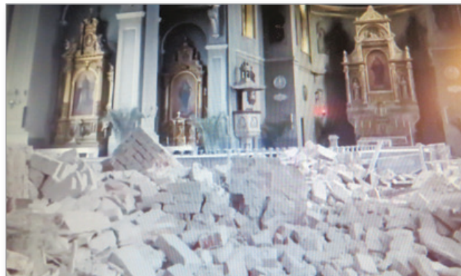
Potres v Zagrebu, ki so ga občutili tudi prebivalci Cerkevjenjaka, je močno poškodoval zagrebško katedralo.

ce Cerkevjenjaka. Mnogi lahko iz svojih domov ali iz stolpa gasilskega doma v središču Cerkevjenjaka s prostim očesom vidijo Sljeme nad Zagrebom. Mnoge Cerkevjenjačane in Cerkevjenjačanke, ki so v času potresa še spali, je zibanje tal prebudilo, tako da so hitro skočili iz postelje ter poiskali zavetje med podboji.