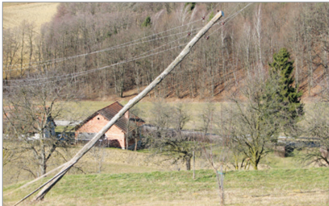
Ta električni drog je pred februarjskim vetrolom visel na levo, zdaj visi na žicah v desno.

silci, so jih na pomoč klicali tudi takšni, ki bi si kakšnih deset strešnih opek bili sposobni sami zamenjati. Nenazadnje za tovrstno pomoč niso niti gasilci usposobljeni. Tako, da v primeru nezgode posledice nosijo sami. Vsi pa vendar niso klicali druge pomoči, večina prizadetih občanov je posledice sanirala v lastni režiji.