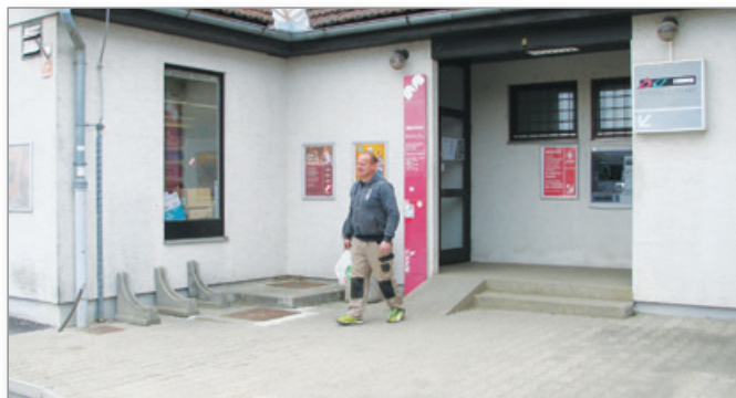
Tudi v trgovinah KEA in Mercator ta dan ni bilo veliko strank. Kupci so prihajali bolj redko. F. B.

Veliko ljudi je zaradi situacije moralo precej spremeniti svoj življenjski stil, vplivi se kažejo praktično povsod. Še najmanj pa se pozna sprememba življenja na deželi. Znamo danes ceniti svobodo, ki jo imamo, ko stopimo na zrak, gremo na vrt, se lahko prosto sprehajamo po svoji zemlji? V teh dneh je to še posebej pomembno, gibanje na prostem zraku in soncu (predvsem v opoldanskih urah), uživanje veliko sveže zelenjave in sadja (regrata je zunaj že dovolj ...), uživanje zadostne količine tekočin, redno gibanje ... vse to so načini, kako lahko sami spodbudimo svoj imunski sistem. Na deželi je na splošno več možnosti za preživljanje kvalitetnega časa zunaj in to moramo v teh časih izkoristiti.