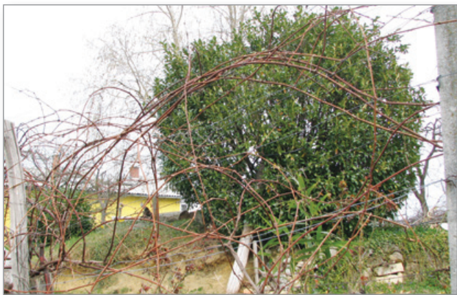
Elektrikarjem do oddaje članka v uredništvo še tudi ni uspelo postaviti tegale električnega droga.

Občani Občine Cerkevjenjak pa so ta dan ostali tudi brez oskrbe električne energije.