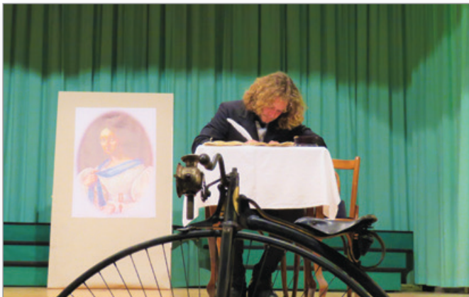
France Prešeren piše o svoji največji ljubezni

V zimskem času nam je uspelo vzpostaviti tudi spletno stran društva, ki jo najdete na spletnem naslovu www.med-nami.si . Sicer potrebuje še nekaj kozmetičnih popravkov, že domena pa nakazuje na osnovno idejo društva, ki je druženje. Znotraj društva, med društvi, med ostalimi organizacijami ... vedno ostanite med nami. Poleg predstavitve delovanja sekcij bomo sproti ažurirali tudi vse aktivnosti in dogodke, posebno podstran pa smo namenili tudi festivalu narodno-zabavne glasbe. Ena izmed pomembnejših podstrani so kontaktni podatki in opisi aktivnosti od ostalih aktivnih društev, ki nimajo svojih spletnih strani, saj želimo s povezovanjem in medsebojno pomočjo doseči tudi večjo prepoznavnost našega delovanja in tudi kraja samega.