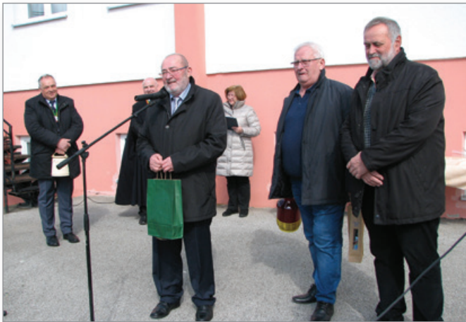
Po stari navadi gostje iz Odrancev niso prišli praznih rok.