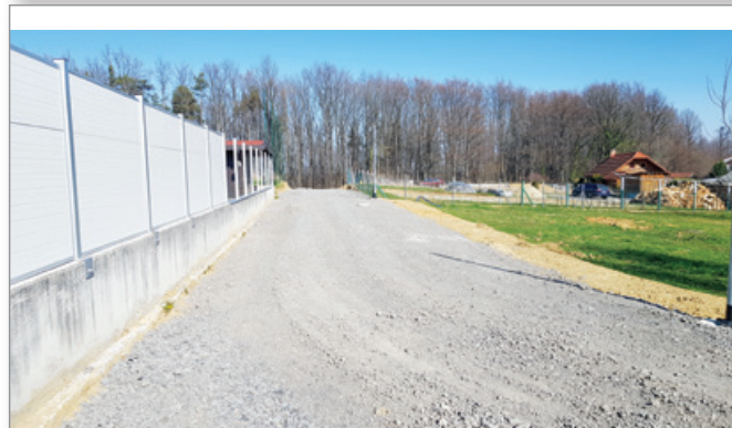
Komunalna ureditev novega naselja Cogetinci (Nedeljko)

Občina je v občinskem proračunu za leto 2020 zagotovila potrebna finančna sredstva, v okviru JR izbrala najugodnejšega ponudnika (Komunala Ptuj d.o.o.) za ureditev I. faze komunalne opreme za predmetno naselje. Ta oprema je bila zaradi ugodnih vremenskih razmer izgrajena že v zimskih mesecih ter je obsegala izgradnjo ceste v makadamski izvedbi z navezavo na regionalno cesto, meteorno kanalizacijo za potrebe ceste, fekalno kanalizacijo, telekomunikacijsko kabelsko kanalizacijo, električno in vodovodno omrežje ter javno razsvetljava. Zazidljive parcele tako