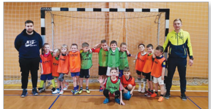
Prijateljska tekma v Sveti Trojici

Naši najmlajši so imeli le en termin v telovadnici, saj ni bilo več prostih terminov. Pozimi so pridno trenirali in se v februarju na prijateljski tekmi pomerili s KMN Sveta Trojica. Igrali so pri sosedih in jih na njihovem domačem terenu premagali kar z 9:1, vendar rezultat ni na prvem mestu. V povprečju je treninge obiskovalo 8 igralcev. Selekcijo smo tudi oblekli v klubske trenirke.