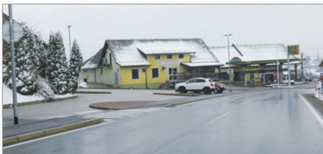
V delovnem času tako prazno pred zadrugo in pred Tuševo trgovino verjetno še ni bilo.

Naglo širjenje novega koronavirusa je ljudi opozorilo, da so v globalnem svetu mnogo bolj soodvisni, kot so doslej mislili, zato jim ne more in ne sme biti vseeno, kako živijo, kaj počnejo in kako ravnajo ljudje in z ljudmi v drugih delih sveta.