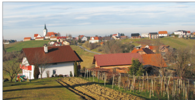
Pogled na Cerkevjak z najvišjega stanetiškega grebena na Silvestrovo 2019