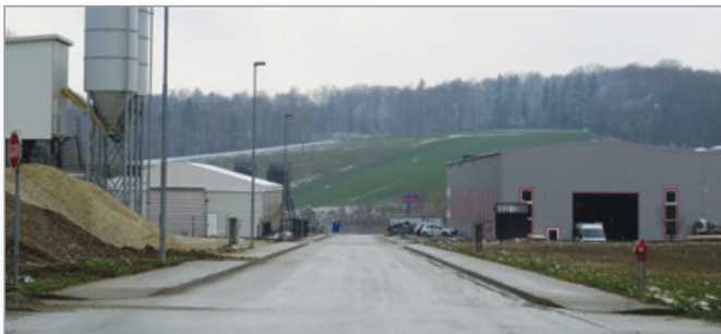
V Poslovno-obrtni coni v Brengovi je bilo kot v mestu duhov.