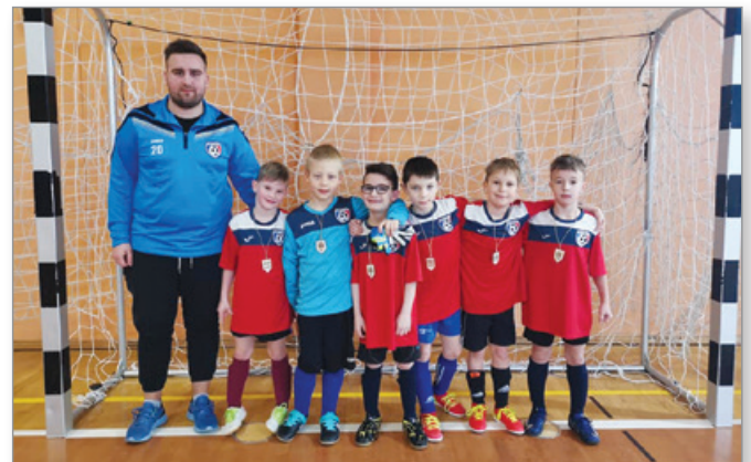
Zimska liga, Sveta Trojica

Naša najmlajša tekmovalna selekcija je zimo preživela s treniranjem v telovadnici OŠ ter aktivnim igranjem v zimski ligi v Sveti Trojici. Nastopili so kar z dvema ekipama in v močni konkurenci, kjer je igralo kar 14 ekip, zasedli 8. in 10. mesto. Z malo sreče pa bi lahko bili med najboljšimi ekipami. Nekateri fantje so priključeni tudi že k U11. Tudi selekcija U9 je dobila nove trenirke.