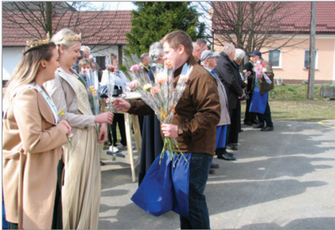
Ker je potekala rez na sam dan žena, je bil nežnejši spol deležen vrtnice.