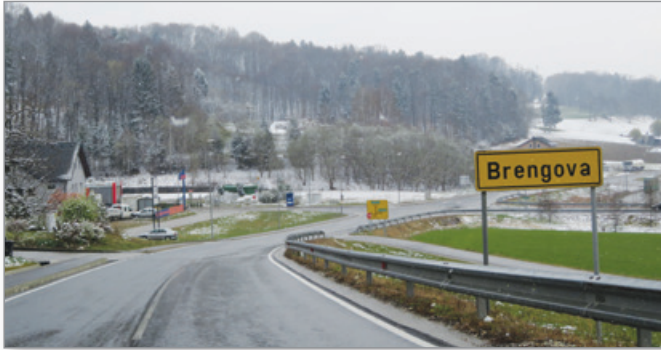
Tudi promet v Brengovi je »izumrl«.

O novem koronavirusu je bilo in še bo veliko napisanega in povedanega. Poleg resničnih se širijo tudi nekatere zmotne in napačne trditve in ugibanja. Zato je za vse, ki želijo imeti točne informacije o koronavirusu najbolje, da pokličejo na tel. 080 1404 med 8 in 20 uro. Epidemiologi Nacionalnega inštituta za javno zdravje Slovenije pa so dosegljivi na številki 031 646 617 med 9. in 17. uro.