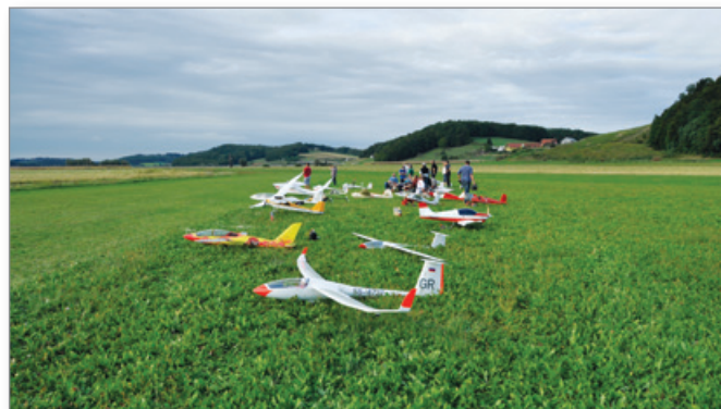
Modelarji v akciji

Cilj kluba za v prihodnje je predvsem zagotavljati najboljše možne pogoje za varno letenje tako za motorne pilote, modelarje kot motorne padalce. Prav tako želimo še naprej aktivno sodelovati z domačimi in tujimi klubi ter delati na približevanju letalskega športa vsem zainteresiranim. Zato vse zainteresirane vabimo, da se nam pridružite v klubu ali vsaj na naših prireditvah.