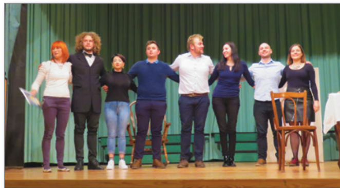
Prešerno s Prešernom - voditeljici in glavni nastopajoči

V tem času pa nam je vseeno uspelo pripraviti nekaj prireditev, ki so bile odlično obiskane. V decembru smo izvedli božični koncert naše zborovske sekcije, ki je predstavljen v posebnem članku, kot novost pa smo prvič izvedli samostojno prireditev Prešerno s Prešernom. Za obeležitev kulturnega praznika smo hoteli pripraviti nek poseben dogodek, ki ni proslava, ki ne vsebuje suhoparnih govorov in ki je edukativne ter zabavne narave. Vanj smo vključili pevski zbor, prizore naših dramskih igralcev, instrumentalne vložke, pripovedovanje o Prešernovem življenju, recitale znanih verzov našega največjega pesnika, v goste pa smo povabili tudi mladinsko sekcijo igralcev iz sosednjih Vitomarcev, ki so na zabaven in dinamičen način predstavili vsem znanega Povodnega moža. Povezovalna rdeča nit je bilo podajanje insertov iz zasebnega in javnega življenja Franceta Prešerna preko različnih oblik sporočanja, kar so obiskovalci znali razumeti. Verjamemo, da se bo ta prireditev v izboljšani različici še velikokrat ponovila.