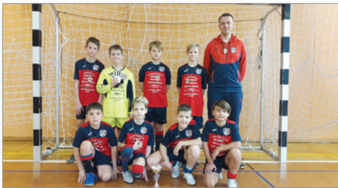
Zimska liga - 2. mesto, Sveta Trojica