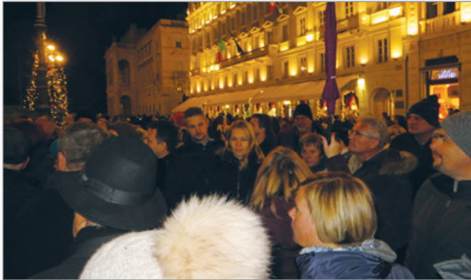
Cerkvenjačanke in Cerkvenjačani so Trst, v katerem živi številčna avtohtona slovenska manjšina, obiskali v prednovoletnem času.

gosti zadržali na družabnem srečanju, na katerem je bilo obilo priložnosti za medsebojno spoznavanje in navezovanje stikov ter za izmenjavo informacij in izkušenj.