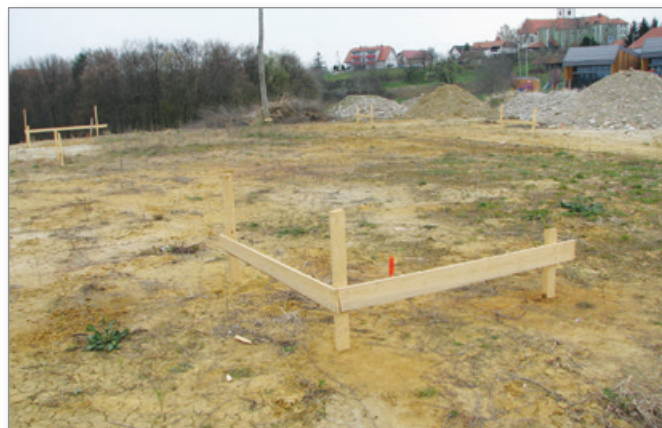
Nekaj se premika. Zakoličeno je in, kot kaže, se bo gradnja nove poslovne stavbe, v kateri naj bi bila tudi Mercatorjeva trgovina, začela. F. B.

Nov trgovski objekt je že zakoličen. Njegov investitor je podjetje GDO (Gradnje dom okolje) d.o.o. iz Gornje Radgone. Gre torej za investicijo zasebnega podjetja. Občina pri tej investiciji torej nima veliko besede, temveč si samo prizadeva, da bi investitorju zagotovila ustrezno podporno okolje in pomoč. V novem trgovskem objektu bo tudi prostor za lekarno. Občina v zvezi s tem že išče rešitve za to, da bi v Cerkvenjaku odprli lekarno, ki jo občanke in občani zelo potrebujemo.