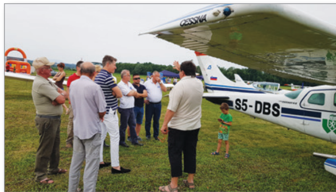
Obramba pred točo iz Cerkevnika

Drugače pa v klubu potekajo aktivnosti za podaljšanje vzletišča v Čagoni, kajti projekt obrambe pred točo z letali, ki se je nekaj časa v juliju izvajal tudi iz vzletišča Cerkevjak in razvoj letalskega turizma že sama po sebi kliče za podaljšanje vzletišča in sicer severno proti avtocesti za cca 200 m. Obstoječe dimenzije ne omogočajo varnega letenja za tipe letal, ki se koristijo za protitočno obrambo z letali in tudi letala iz tujine, ki bi nas lahko obiskala imajo zahteve po daljši pristajalni stezi.