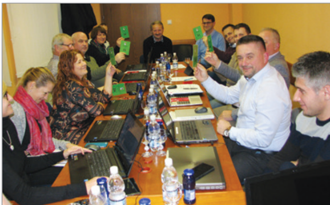
Kot lahko opazimo, imajo svetniki in seveda tudi svetnici za glasovanje zdaj na voljo pripomoček v obliki ustreznega kartona.

Letos se je Občinski svet Občine Cerkevjenjak prvič sestal v sredo, 29. januarja, in namreč na svoji že deseti redni seji v tem mandatu. Na dnevnem redu so imeli devet zadev. Po ugotovitvi sklepčnosti in zatem potrditvi sklepov z devete seje so prešli na vročo točko dnevnega reda Sklep o potrditvi cen izvajanja obveznih občinskih gospodarskih javnih služb ravnanja z odpadki v Občini Cerkevjenjak. Seznanili so se z elaboratom o oblikovanju cen izvajanja storitev obveznih občinskih gospodarskih javnih služb ravnanja z odpadki na območju občin UE Lenart, ki sta ga izdelala izvajalec javnih služb v Občini Cerkevjenjak, podjetje Saubermacher d.o.o. Slovenija in CEROP d.o.o. Obrazložitev in pojasnila so podali predstavniki Saubermacherja in Ceropa. Razlogi, ki terjajo spremembo cene teh storitev so in ostajajo enaki, kot so svetnikom bili predstavljeni že na lanski osmi seji občinskega sveta, o čemer smo poročali v božično – novoletni številki Zrnja. Svetniki sklepa takrat niso potrdili. Če vemo, da cena storitve odvoza od gospodinjstev že pet let ni bila spremenjena, in če razumemo, da v smeteh in odpadkih ni več dobičkov ter se jih vsi otepajo, so svetniki tokrat ta sklep sprejeli. In položnice bodo nekoliko višje.