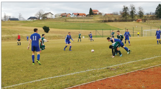
Pripravljana tekma proti NK Cankova

S pripravami na spomladanski del sezone je članska ekipa začela v četrtek, 13. 2. 2020. Po napornih treningih pa so tudi že odigrali nekaj pripravljanih tekem. Najprej so se v domačem ŠRC pomerili z NK Cankova in jih premagali z 2:1, nato pa sta sledili tekmi proti NK Tišina in NK Limbuš Pekre, ki sta se obe končali z rezultatom 0:0. Žal so tudi člani prekinili z vsemi aktivnostmi, čakamo pa tudi na obvestila iz strani MNZ Maribor o nadaljnjem poteku tekmovanja v 2. članski ligi MNZ Maribor.