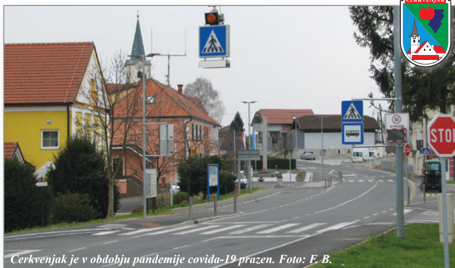
Cerkevňjak je v obdobju pãndemije covida-19 prãzen.