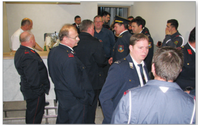
Udeležence občnega zbora so presenetili renovirani prostor pred vhodom v dvorano in sanitarije.